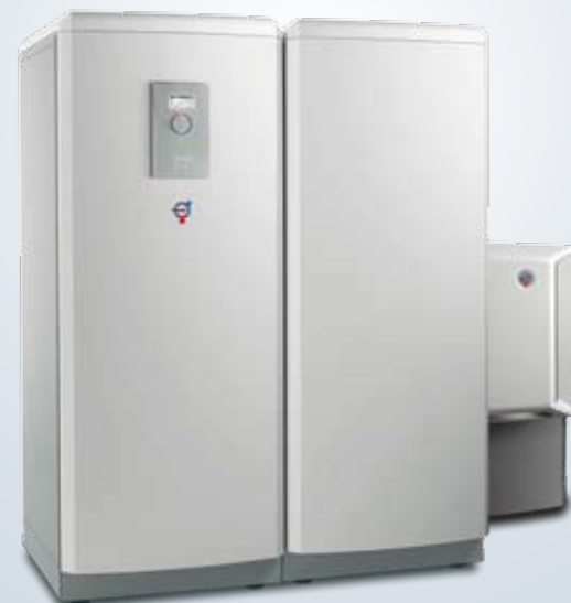
Atria Duo Optimum

Thermia Atria Duo Optimum är en variant av Thermia Atria Optimum. Det som skiljer de båda modellerna åt är att Thermia Atria Duo Optimum har separat varmvattenberedare, och därför passar på ställen med låg takhöjd.