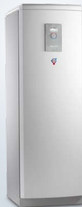
Diplomat Duo Optimum